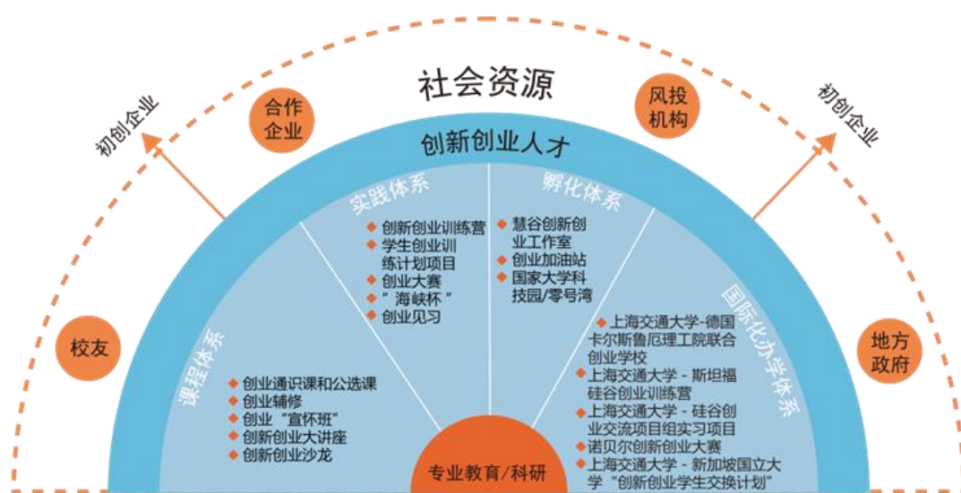
上海交通大学创业人才培养生态体系

创业导师、创投导师参与创业课程的讲授和学生创业实践的指导，建设完整的创业人才培养体系，同时将创业学院打造成创业教育资源聚集的平台。一批青年创业校友企业迅速崛起，如饿了么、商汤科技及依图科技等独角兽企业有望在科创板上市，上海交大敢为人先、与时俱进的创新精神，激发越来越多的在校学子和校友投身创业，立志成为实业界翘楚。